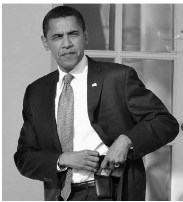
Obama, Blackberrysi ile.

“Dış görünüşe aldanmayın” diye bir laf vardır. Kimi arkadaşlarım “Koskoca ABD Başkanı’yla aynı telefonu kullanıyorum” diye hava atıp içleri rahat şekilde dolaşırken tam da bu hataya düştüler. Başkan’ın elindeki telefon görünüş olarak kendilerinkiyle aynıydı belki ama ya işlevi?