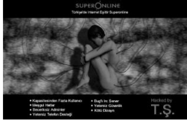
Superonline internet sitesine giren kullanıcıların karşılaştığı görsel (1999).

Superonline’ın sahibi Mehmet Emin Karamehmet’ti. Milyarlarca dolarlık bir servete hükmeden bu adam istese beni saniyesinde ortadan kaldıracak güce sahipti. Tam binlerce düşünceye dalmış biçimde kafamı toparlamaya çalışırken ev telefonu çaldı. Annem telefonu açtı ve beni aradıklarını söyledi.