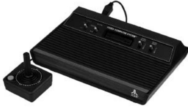
Tüm dünyada milyonlarca ucuz kopyası yapılan Atari oyun konsolu.

Bizi hiçbir şeyden mahrum bırakmayan, o zamanların henüz yeni yeni yayılan havalı spor ayakkabılarına bile anlam verememesine rağmen para harcayan babam, bilgisayar konusuna bir türlü sıcak bakmıyordu. Hal böyleyken tek çarem bilgisayara kolayca erişimimin olabileceği yerleri düşünmekti. Eğer onlardan birini yanıma alamıyorsam, ben onların yanına gitmeliydim.