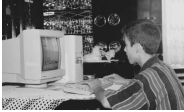
15 yaşında sahip olduğum ilk bilgisayarım.

Bilgisayarıma kavuştuktan sonra epey bir süre yap boz usulü geçti. Klasik bir kullanıcının uğraşmaması gereken ne varsa kurcalayarak sistemi sık sık çökertiyordum.