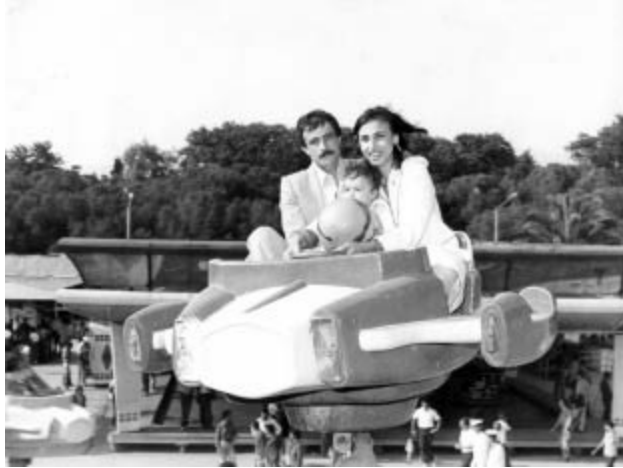
İzmir Enternasyonal Fuarı. Annem, babam ve ben (1982).

Kalabalık bir aileden gelmenin en güzel yanı anlatacak ilginç anekdotların olması. Dinlediklerim arasında benim en çok ilgimi çeken ise dedem ile anneannemin evlilik macerası.