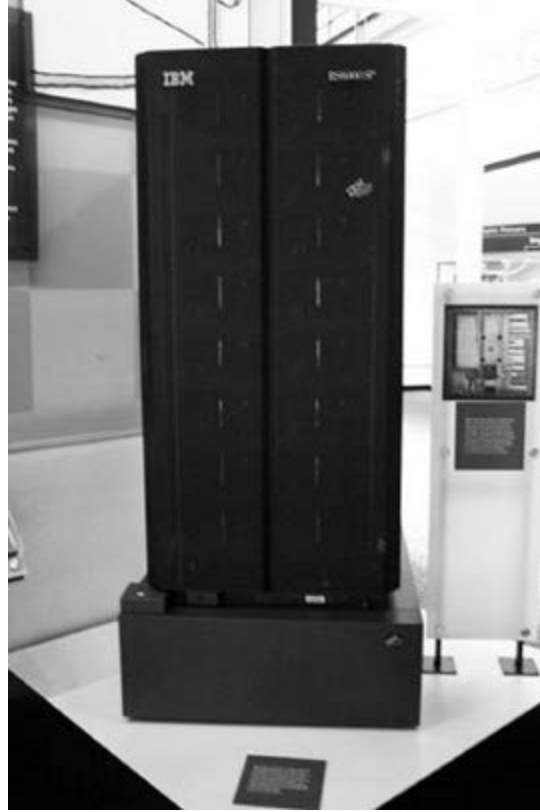
Satranç ustası Kasparov ile maç yaparak ünlenen, Osmanlı Bankası'nın kullandığı IBM Deep Blue bilgisayar.

T. Ş. imzasından dolayı gözler ister istemez benim üzerimdeydi. Arkadaşımın tanıdığı aracılığıyla bankanın içerisinden haberler geliyordu. İçerideki bilgi işlemden sorumlu kişi sisteme koyulan ts.html dosyasını silerek üstlerine aslında hack edilmediklerini iddia ediyordu. Bu iddia üzerine hem ts.html dosyası gizemli şekilde tekrar sunucu hack edilerek yerine koyuluyor, hem de bir internet sitesinde binlerce banka müşterisinin fotoğrafları yayınlanıyordu. Süreç tamamıyla internet üzerinden işlediği için benim gibi binlerce insan da bu yaşananlara anında şahit oluyordu.