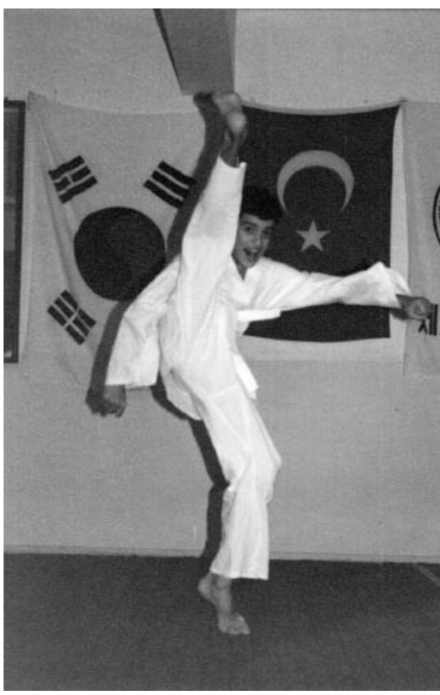
Kim Doo Man Taekwondo İhtisas Spor Kulübü (1994).

Hocamızın ağır antrenman şartlarından şikâyet edenler olsa da o hep daha ağır antrenmanların olduğunu bize hatırlatırdı. Bu yüzden hepimizi toplayıp Koreli çocukların buz içinde yaptığı idmanları seyrettiriyordu. Eve gelip burkulan ayağıma sıcak suyla masaj yapıp yorgunluktan külçe gibi yatmak artık bir rutin olmuştu.