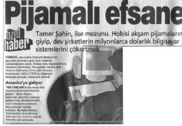
Milliyet gazetesi sürmanşet (2001).

Pazartesi olduğunda haberimin yayımlanacağını tamamen unutmuşum. Ama başkaları unutmamış olacak ki telefonum sabah erkenden çalmaya başladı. Cevpladığımda telefondaki ses “Abi yuh! Milliyet ’e sürmanşet olmuşsun!” diyordu. Hemen kalkıp gazeteyi almaya gittim. Gazeteyi elime aldığımda bilgisayar başında arkadan gözüken bir fotoğrafım ve üstünde “Sanal Alemin Zorro’su” başlığı vardı.