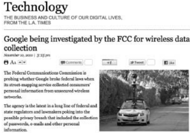
Los Angeles Times, Google kablosuz ağlardan veri topluyor haberi (2010).

Herkes emo gençlik gibi kendi resimlerini rötuşlayıp, kesip biçecek uzmanlıkta olmadığından basit araçlara ihtiyaç duyabiliyor. Picasa hem internette resimleri saklamak, hem de biçimlendirmek için kullanılan pratik bir araç. Ama fotoğraflar sadece hoş anıları saklamıyor. Geotag özelliği olan mobil telefonlarla çekilen fotoğrafların içinde çekildiği yerin koordinatları da yer alıyor.