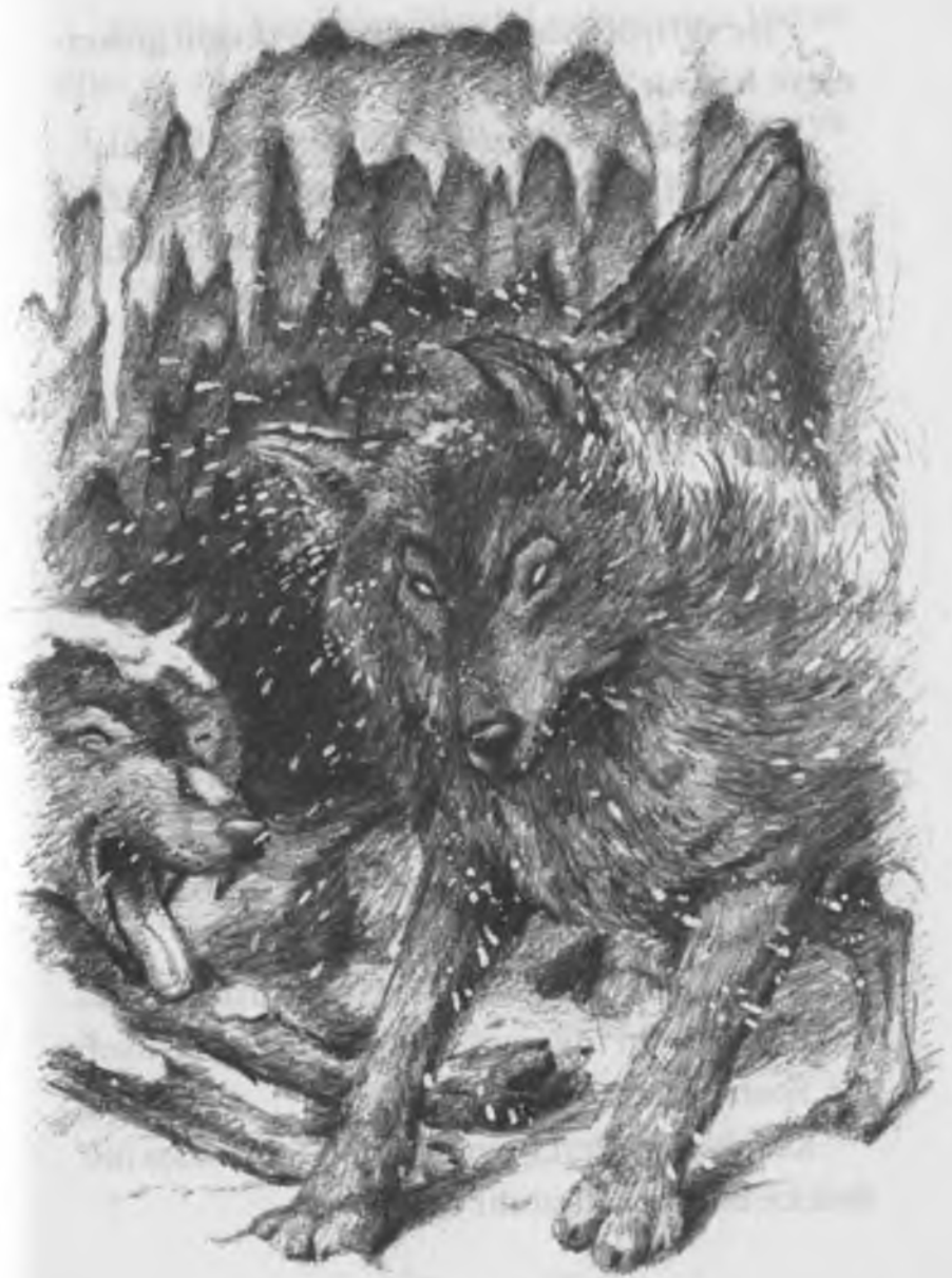
Büyük Buz Savaşı / F:4