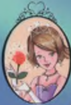
Kıtap 7 Prenses Charlotte

Prenses Alice ve arkadaşları okul gezisine çıkıyor. Muhteşem Kraliyet Yaşantısı Müzesi'ni ziyaret edecekler. Alice kristal ayakkabıyı giymenin hayalini kuruyor, oysa kötü Prenses Diamonde'nin başka planları var.