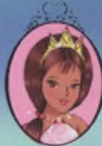
Kıtap 9 Prenses Daisy