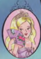
Kıtap 11 Prenses Sophia