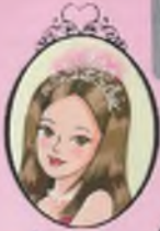
Kitap 14 Prenses Jessica