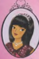
Kitap 17 Prenses Lauren