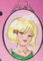
Kitap 18 Prenses Amy