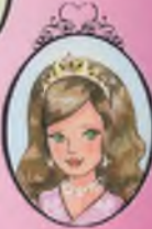
Kitap 15 Prenses Georgia