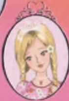
Kitap 21 Prenseler Lucy