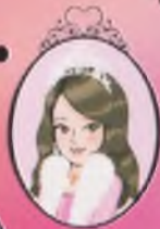
Kitap 24 Prenseler Sarah