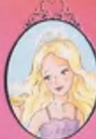
Kitap 22 Prenseler Grace