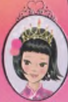
Kitap 23 Prenseler Elise