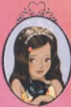
Kitap 19 Prenseler Hammeli

Sihirli Dağlar'da Lord Henry'nin şatosuna bir gezinti herkesi heyecanlandırıyor! Prenses Isabella şanslı olup tek boynuzlu bir at görmeyi ümit ediyor. Bakalım hayali gerçekleşecek mi?