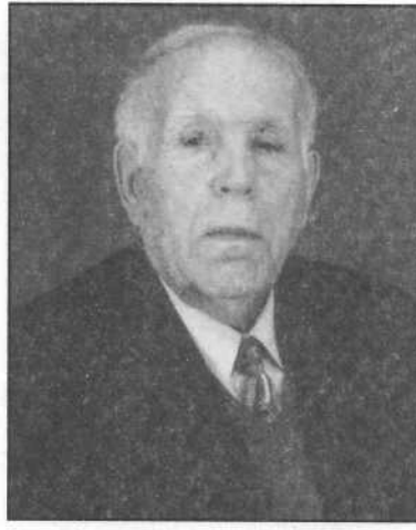
Karabağ İmdat Çılgılığı (Karabağ Harayı)